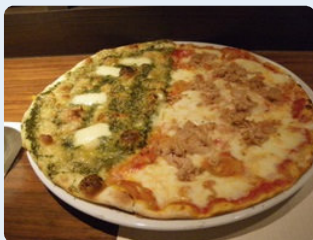
カーサ・ディ・ナオのピザは2種類のトッピングが乗ってくる