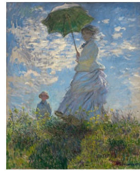
『日傘を差す女』 1875クロード・モネ

屋外ですから太陽の光は朝夕変化します。画家たちは空間の奥行きや物の質感よりも、光によって移り変わる色や空気の流れをとらえる新しい表現に夢中になりました。当時は写真が普及し始めており、見た物をそのまま写すだけでは写真には勝てない、と考えたのかもしれない。