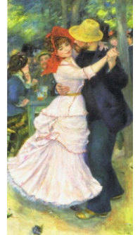
『ブーヅヴァルのダンス』 1883 ピエール＝オーギュスト・ルノワール