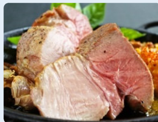
いろんな食材をガッツリと料理するのがモンドの信条。うまい！