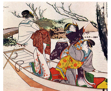
『梅見の図』 1794年 葛飾北斎

浮世絵の鮮やかな色彩と大胆な構図を目にした画家たちは「忠実に描く」ことだけが美しさではないとカルチャーショックを受けたのです。余談ですが、当時の浮世絵は日本ではそば一杯分位の値段だったとのこと。陶器などの包み紙に使われてヨーロッパに伝わったようです。