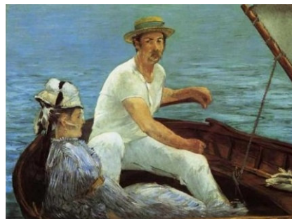
『舟遊び』 1887年 クロード・モネ

また19世紀のヨーロッパでは日本趣味(ジャポニスム)が大流行しました。なかでも浮世絵の人気は際立っており、ゴッホやモネが浮世絵をコレクションしていたことは有名です。舟遊びの場面を描いたマネの絵などは構図、主題、ともに浮世絵から影響を受けたものですね。