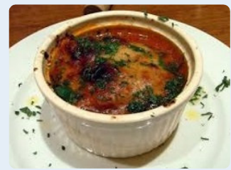
ヴィア・デラ・ファッジョーラ54のフィレンツェ風トリッパ。