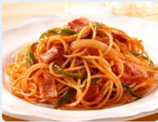
玉葱やピーマンが入ってケチャップで味付けするナポリタン。

今月は福岡のイタリア料理です。イタリア料理がこんなにポピュラーになったのはたぶん1990年代のバブル景気以降のことで、私が10代の頃（昭和40年代）はパスタなんて呼び名などまだ無く、イタリア料理らしき食べ物と言えば、喫茶店で食べるナポリタンとミートソースの2種類のスパゲティだけでした。20代になって親不孝通りにお洒落なスパゲティ屋さんが出来、デートコースのベストチョイスになったのが、今や郊外マーケットのフードタウンの定番となった『ピエトロ』でした。当時、彼女の前で和風スパゲティを注文するのがシテイボーイのお約束だったのですから、なんとまあ時代は変わったものですねえ。今や福岡のイタリアンが何軒あるのか想像もつきませんね。