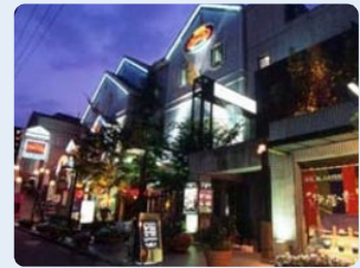
80年代に一世を風靡した親不孝通の名物ディスコ『マリアクラブ』。

私が福岡で一番おいしいと思うイタリアンはけやき通りの『 ペルケ・ノー 』(092-725-3579)です。ここはほんとに何を食べても美味しいです。警固界隈は美味しいイタリアンが目白押しです。『 イル・ボッコーネ 』(092-731-1536)も改装して店内が明るくなりました。個室もあっておおぜいの時に便利です。秋元病院の裏にある『 ヴィア・デラ・ファッジョーラ54 』(092-716-5401)も小さいながら隠れ家っぽくて素敵な店です。薬院方面に行くと、『 カーサ・ディ・ナオ 』(092-404-7030)は石橋シェフの本格的南イタリア料理が堪能できます。最近、中国の天津にも支店が出来ました。名物のピッツァを是非食べてみてください。もうちょっと平尾方面に行くと、ビルの2階にあるのが『 モンド 』(092-531-5420)。二宮君のテキトーそうで繊細な料理が魅力です。最後は、深夜にイタリアンが食べたくなった時の切り札が高砂の『 ピッコラ・フェリーチェ 』(092-525-2108)。日曜でも夜更けの1時まで本格派のお料理です。