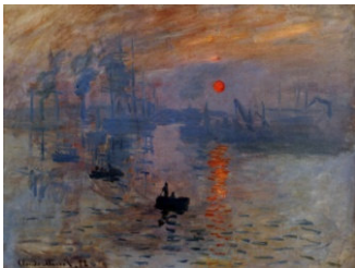
『印象、日の出』 1872 クロード・モネ

今でこそ人気の高い印象派ですが、写実的な絵画が美しいとされていた当時のサロンでは散々な評価でした。