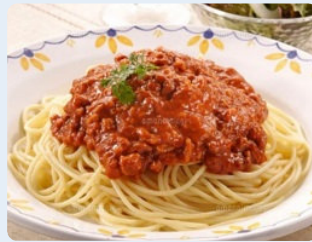
ミートソースはカレー同様に子供に大人気の食べ物でした。