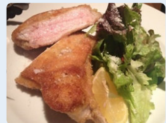
ピッコラ・フェリーチェの名物はフィレンツェ風豚のカツレツです。