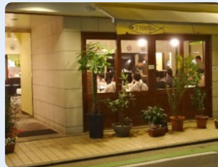
なかが見えて入りやすくなったイル・ボッコーネ。美味しいです。